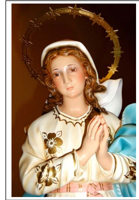
Inmaculada Concepción - Pastrana -