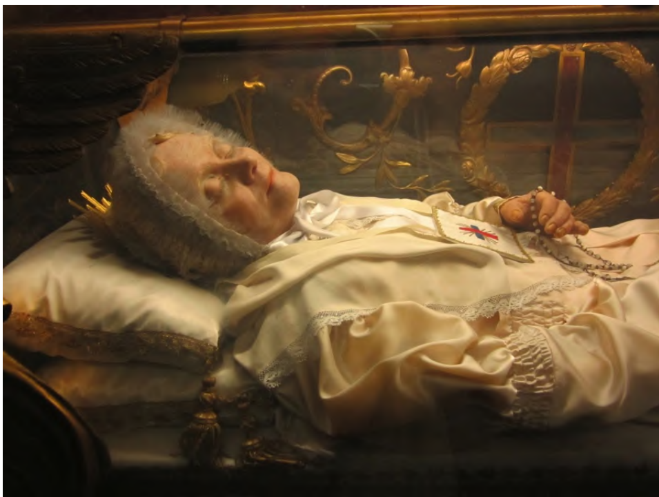
Su cuerpo incorrupto se encuentra en Roma donde aun se puede ver dentro de un ataúd de vidrio en la Iglesia de S. Juan Crisógono. Foto tomada en Abril del 2011.

Para hacer frente a la irreligiosidad y al ateísmo crecientes de finales del siglo XVIII, Dios suscitó de manera diversa y en diversos lugares distintas almas de gran valía, a fin de reconducir a la humanidad que se perdía en el pecado y en la incredulidad. Entre ellas hubo una que fue, sin duda, en palabras de Louis Veuillot, la “respuesta divina a todos los victoriosos del campo de batalla, de la política y de las academias”, y cuyas oraciones, según la afirmación del cardenal Salotti, “tenían ante Dios más poder que los ejércitos napoleónicos”: la Beata Ana María Taigi. En su tiempo Anna-Maria Gesualda Antonia Gianetti, abnegada y trabajadora esposa, sirvienta, esposa y terciaria trinitaria, quien durante el siglo XIX será una de las mujeres más populares y de mayor fama de santidad en Roma, siendo honrada con la particular estimación de tres sucesivos Pontífices y cuya pobre casa fue el centro de reunión para muchos de los altos personajes de la Iglesia y el Estado que buscaban su intercesión, su consejo y su opinión, en las cosas de Dios. Su existencia transcurrirá durante uno de los períodos más críticos para la Iglesia y Europa. La corte de Luis XV, hundida en la lucha de intrigas y voluptuosidades,