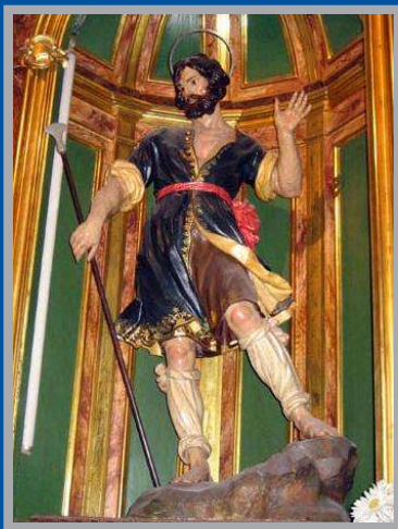
San Isidro Labrador. Francisco Salzillo (atribución), c.1750. Parroquia de San Juan Bautista. Murcia.

El 15 de mayo se celebra la fiesta de San Isidro Labrador, santo español cuya devoción está profundamente arraigada en las zonas rurales. Son muchos los templos que cuentan con alguna representación artística del santo madrileño, pero sin duda, una de enorme importancia y belleza en nuestra Diócesis, y más aún en el panorama nacional, es la que se venera en la parroquia de San Juan Bautista de la ciudad de Murcia. Obra atribuida a Francisco Salzillo, representa al agricultor en el momento que, confiando en la providencia divina, hace brotar un manantial de agua al golpear el suelo con su cayado. La identificación con la indumentaria de los huertanos murcianos es evidente en las calzas sujetas para emprender la faena del riego y en la camisa blanca que asoma bajo la vestimenta, queriendo el artista establecer un vínculo entre cuantos cristianos de Murcia se dedicaban al trabajo de la tierra y el santo agricultor a quienes presentaban sus plegarias. De entre los muchos milagros que obró San Isidro se eligió para esta escultura el del agua, bien tan preciado por los agricultores de nuestra tierra, invitándoles a levantar sus oraciones, confiados igualmente en la divina providencia, y a imitar el ejemplo de quien cultivó, como buen hortelano, la santidad en su vida. Santidad que dio mucho fruto, pues no sólo él la logró, también su mujer Santa María de la Cabeza y su hijo San Illán.