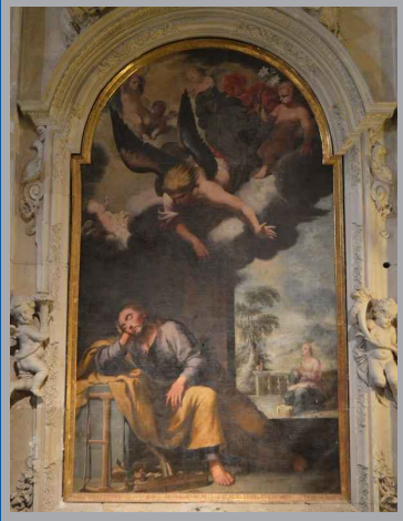
Sueño de San José. Mateo Gilarte. s. XVII. Contraportada de la Catedral de Murcia.

Los días previos a la Navidad la liturgia propone contemplar algunos episodios que anteceden al Nacimiento de Jesús y que recogen los evangelios de Lucas y Mateo. Si el ángel anunció a María que sería la Madre del Dios con nosotros, San José, en sueños, fue advertido de que no tuviera reparo en tomar consigo a su esposa, quien alumbraría al Salvador del pueblo. Junto a la puerta del Perdón, a la entrada del templo catedralicio, dos grandes lienzos de Mateo Gilarte representan sendos pasajes. En el sueño de San José, el Santo Patriarca duerme con las herramientas de trabajo abandonadas a los pies. Viste túnica morada, color de penitencia por la renuncia de su voluntad al aceptar la de Dios; y manto ocre, color de la duda, pues había pensado repudiar en secreto a María. El cielo se ha abierto en su sueño y la turba angélica le muestra el designio divino, mientras un ángel sostiene el lirio de la pureza como premio anticipado, pues al despertar hizo como se le había indicado y tomó a María consigo. La composición quisiera invitarnos a vivir junto a la Virgen, que aparece orando en el fondo de la escena, pues de ella recibimos al que viene a salvarnos.