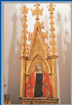
Santa Catalina de Alejandría. Retablo de Santa Lucía, c.1394. Bernabé de Módena. Museo de la Catedral de Murcia.

El retablo de Santa Lucía del Museo de la Catedral de Murcia está rematado con una bellísima crestería en la que al Calvario central lo acompañan cuatro imágenes de santas vírgenes, distinguiéndose únicamente por la iconografía Santa Catalina de Alejandría, que porta la rueda dentada de su martirio. Posiblemente se trate de las llamadas Quatuor virgines capitales : Dorotea, Margarita, Catalina y Bárbara, vírgenes cristianas de la Antigüedad que vivieron el martirio, rechazando el matrimonio por haber preferido ser esposas de Cristo. De este modo complementarían un programa iconográfico donde se ensalza la vida de Santa Lucía, que igualmente renunció a desposar a un joven pagano por consagrar su vida a Dios. El culto a Santa Catalina de Alejandría aparece en Murcia desde el primer momento de la Reconquista, estándole dedicada desde el siglo XIII una de las iglesias de la ciudad. La Catedral contó con capilla bajo la advocación de Santa Catalina, de la que queda memoria en la imagen de piedra policromada de la contraportada. En su imagen del retablo de Bernabé de Módena advertimos la delicada belleza de quien consagra su vida a Cristo pero que se hace fuerte por la fe.