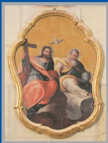
Santísima Trinidad , s. XVIII. Catedral de Murcia.

Este pequeño óleo sobre tabla de la Santísima Trinidad forma pareja con el de San Francisco Caracciolo, conservados ambos en la Santa Iglesia Catedral de Murcia. Se trata de una obra de la segunda mitad del siglo XVIII donde la representación de las tres personas divinas sigue la iconografía tradicional de Cristo sentado a la derecha del Padre. Dios Padre creador del mundo sostiene el orbe y cubre la túnica azul de la divinidad con el manto blanco y dorado de la gloria. Dios Hijo redentor del mundo sostiene la cruz y cubre su túnica azul con el manto rojo de la humanidad con la que se ha revestido. Y el Espíritu Santo adopta la forma de paloma entre ambos.