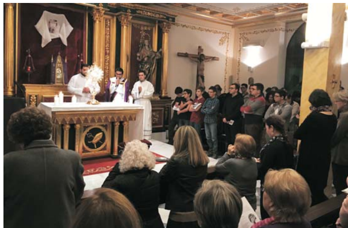
Unas 300 personas participaron en la vigilia por las vocaciones al sacerdocio