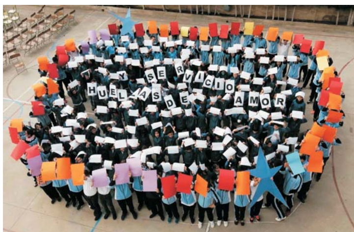
El Colegio La Milagrosa (Blanca) celebra los 400 años del espíritu vivenciano