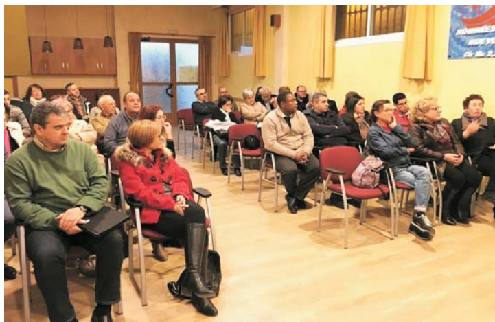
Escuela de Agentes de Pastoral en la parroquia de Puente Tocinos