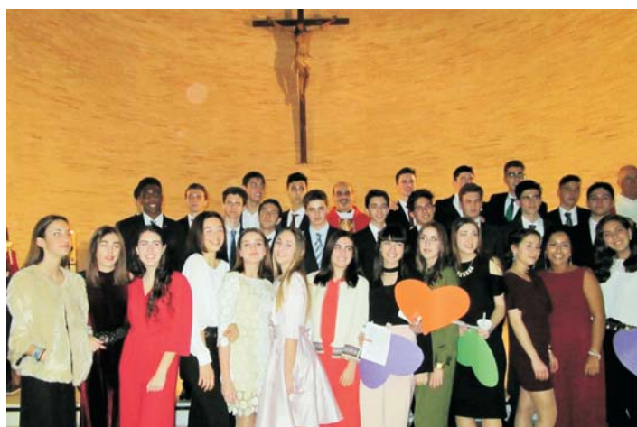
Confirmaciones en la parroquia de Cristo Rey de Murcia