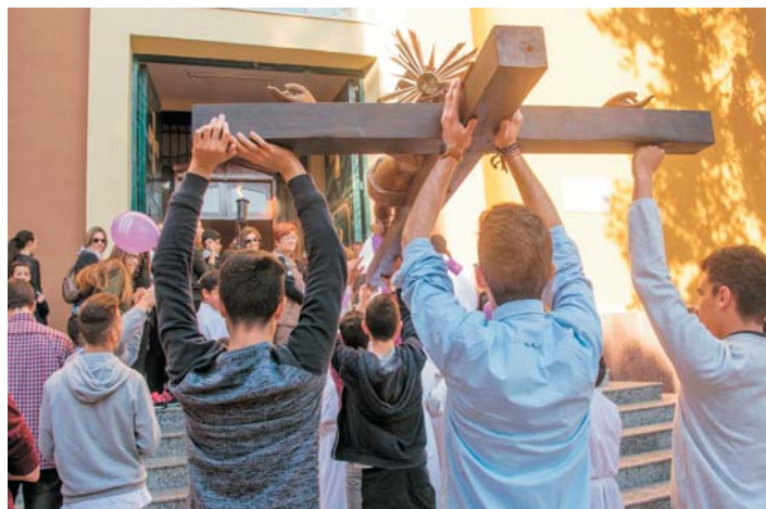
Las parroquias de Cieza inician la Cuaresma rezando el Rosario