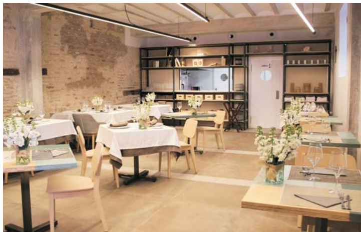
El restaurante-cafetería de eh! abrirá pronto sus puertas al público