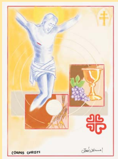
DIBUJO: Mons. Lorca Planes

«El que come mi carne y bebe mi sangre habita en mí y yo en él»