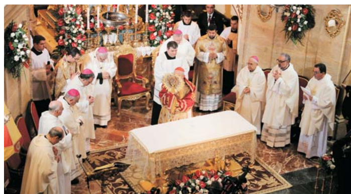
El Cardenal Agostino Vallini presidió la celebración de apertura

Búsqueda, inquietud, curiosidad, fe... son algunas de las palabras que resuenan en las cabezas de muchas personas que inician su peregrinación. Otras, tan sólo se dejan llevar por la inercia, pero cuando se encuentran cara a cara con la Vera Cruz, según el rector