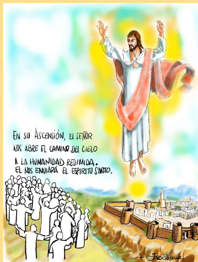
DIBUJO: Mons. Lorca Planes

Y los sacó hasta cerca de Betania y, levantando sus manos, los bendijo. Y mientras los bendecía, se separó de ellos, y fue llevado hacia el cielo. Ellos se postraron ante él y se volvieron a Jerusalén con gran alegría; y estaban siempre en el templo bendiciendo a Dios.