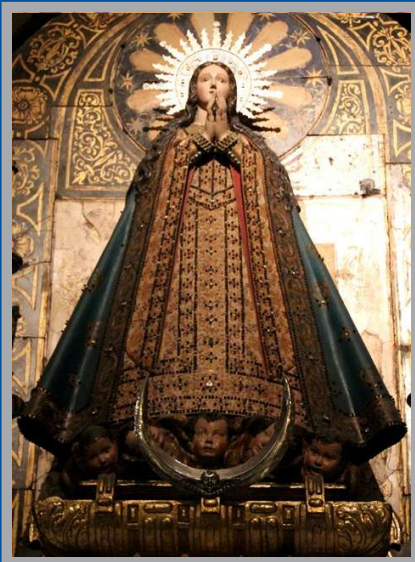
Escuela cortesana. Madrid, c.1620. Capilla del Trascoro, Catedral.

La Catedral de Murcia custodia una de las imágenes más tempranas de la Inmaculada Concepción de todo el arte español. Promovido su culto por el obispo Fray Antonio de Trejo, la imagen de María aparece en actitud de recogimiento y con la simbología del libro del Apocalipsis: "una mujer vestida de sol, con la luna bajo sus pies y corona de doce estrellas".