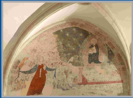
Virgen de la Misericordia. Siglo XV. Museo de la Catedral de Murcia.

El antiguo claustro de la Catedral de Murcia, construido en estilo gótico, donde actualmente se ubica el Museo Catedralicio, estuvo decorado con diversas pinturas murales, muchas de ellas recientemente recuperadas. La preferencia iconográfica para la decoración de este espacio fue la temática escatológica, por tratarse de un lugar escogido para numerosos enterramientos. Esta pintura representa la coronación de la Virgen de la Misericordia, que se acerca a Dios en majestad. La Virgen María, siguiendo la iconografía mercedaria, cobija bajo su manto a multitud de cristianos caracterizados algunos de ellos por las diferentes indumentarias clericales.